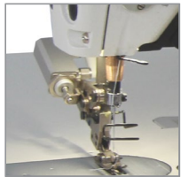
Bird's Nest Preventions Function Boncuk Önleme Sistemi