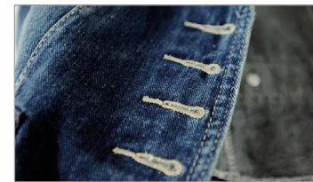
Gözlü İlik Çeşitleri Types of Eyelet Buttonholes