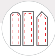
Belt Tip Kemer Dil Ucu