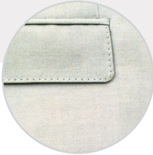
Pocket Flap Ceket Cep Kapağı